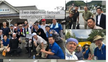
Two Japanese famous entertainers joined