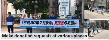
Make donation requests at various places