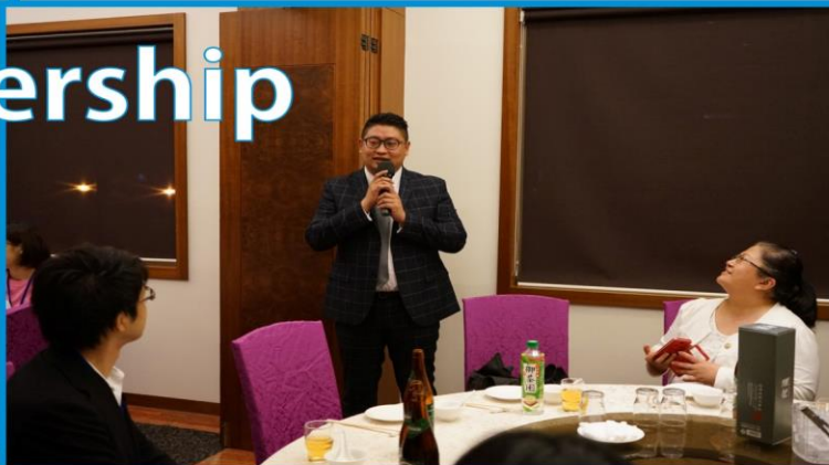
Presidents of 2017