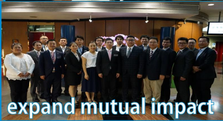
expand mutual impact