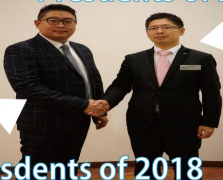
Presidents of 2018