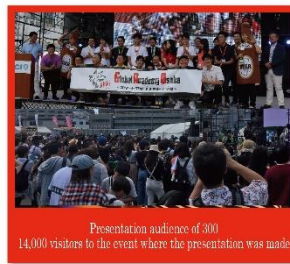
Presentation audience of 300 14,000 visitors to the event where the presentation was made