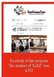
Facebook of this program The number of "LIKE" was 4,553