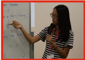
From JCI TAIPEI