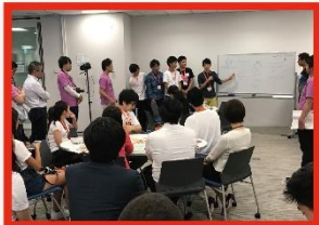
From a global perspective discussion