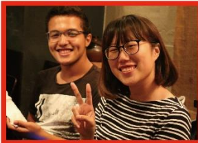
From JCI VICTRIA