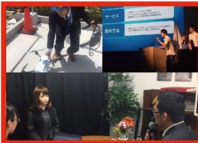
Impact from Advanced Technology