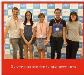
5 overseas student entrepreneurs