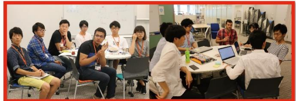
Network of Participating Students and Overseas Student Entrepreneurs

JCI Osaka Business Ecosystem Organizing Project - Global Academy Osaka For Students -