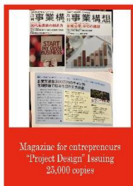
Magazine for entrepreneurs "Project Design" Issuing 25,000 copies