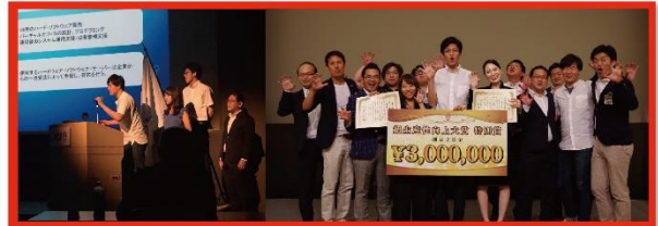
The students participated in a business plan contest organized by JCI JAPAN

JCI Osaka Business Ecosystem Organizing Project - Global Academy Osaka For Students -