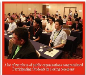
A lot of members of public organizations congratulated Participating Students in closing ceremony