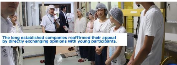
The long established companies reaffirmed their appeal by directly exchanging opinions with young participants.