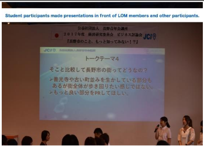
Student participants made presentations in front of LOM members and other participants.