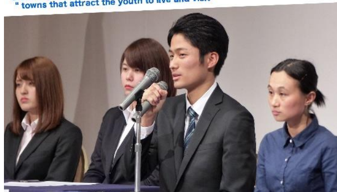
Student participants presenting in the regular meeting under the theme of "towns that attract the youth to live and visit"