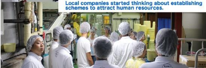
Local companies started thinking about establishing schemes to attract human resources.