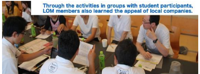
Participation of students in the regular meeting encouraged all LOM members to become more interested in the charm and future of the city.