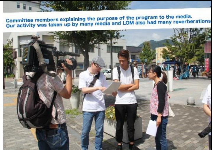
Committee members explaining the purpose of the program to the media. Our activity was taken up by many media and LOM also had many reverberations.