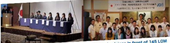
Young participants expressed their impressions and opinions in front of 145 LOM members in the regular meeting.