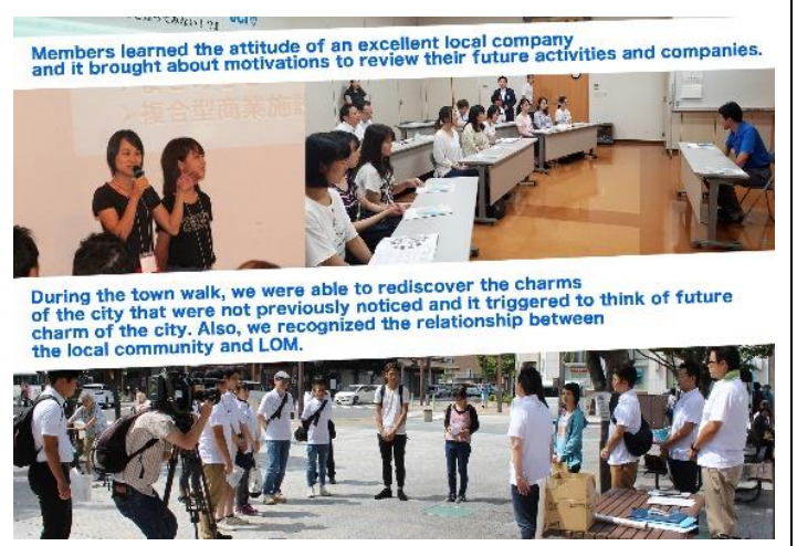
Members learned the attitude of an excellent local company and it brought about motivations to review their future activities and companies.