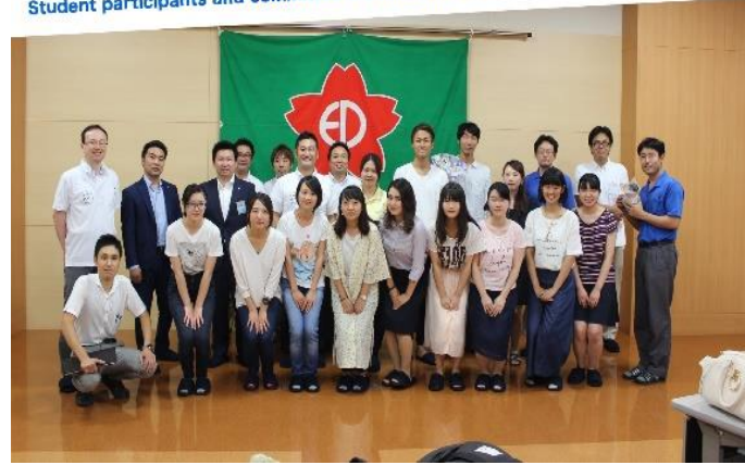
Student participants and committee members in the business discussion session