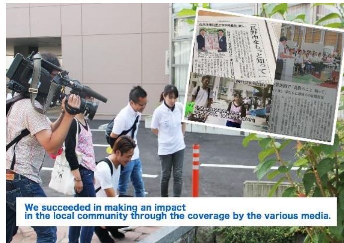
We succeeded in making an impact in the local community through the coverage by the various media.