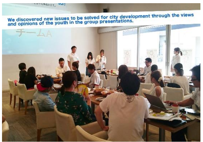
We discovered new issues to be solved for city development through the views and opinions of the youth in the group presentations.