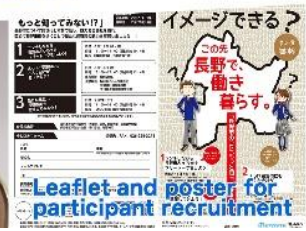
Leaflet and poster for participant recruitment