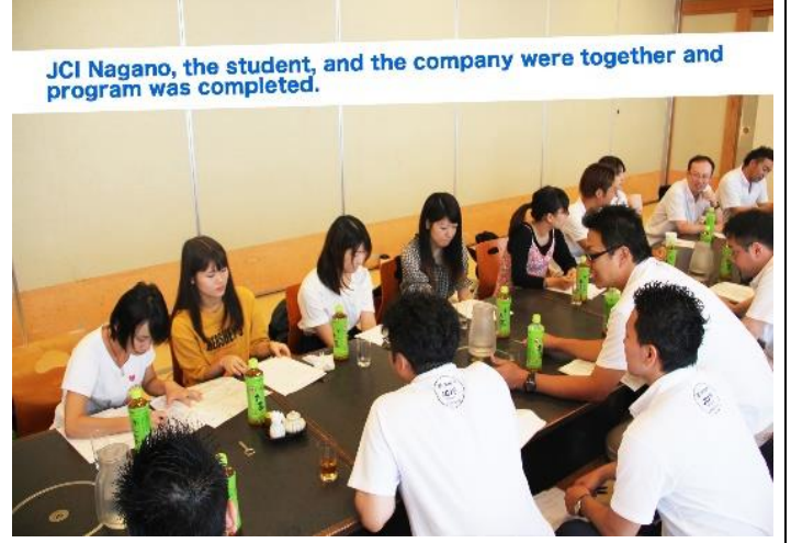
JCI Nagano, the student, and the company were together and program was completed.