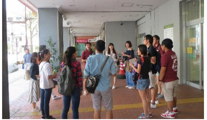
Treasure hunt project