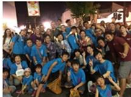
The foreigner who lives in the area participated in the festival as a role of a dance.

A festival named after a wooden statue in Zenko Temple called the Binzuruzonja, and it is also called the Nagano Citizens Festival since it is a citizens participating festival. Various events start during the day, such as Mikoshi carrying with stages and stalls, and at night over 200 Ren groups participate and dance.