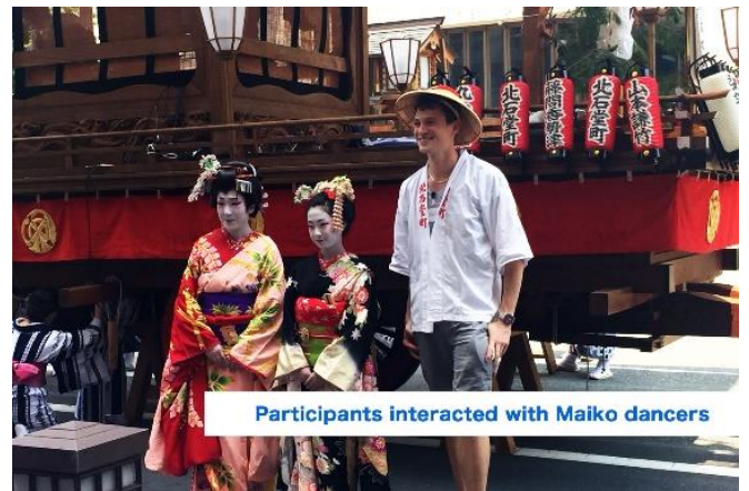
Participants interacted with Maiko dancers