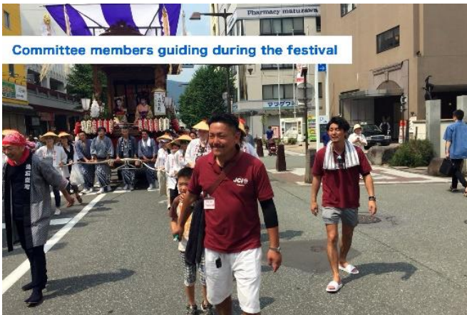
Committee members guiding during the festival

「メンバーへの影響と JCI ビジョンへの貢献」項目に添付する画像を下部に貼付してください