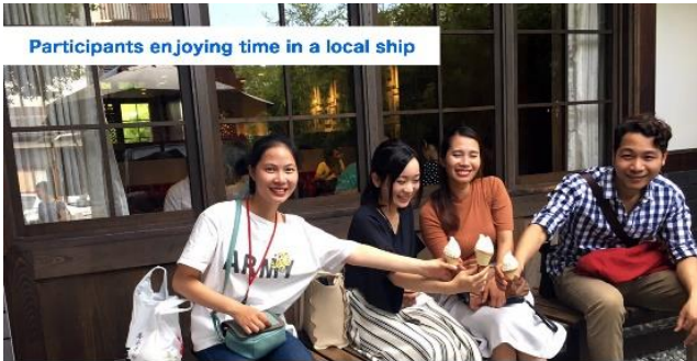
Enjoying shopping in the store of the area also leads to local activity.