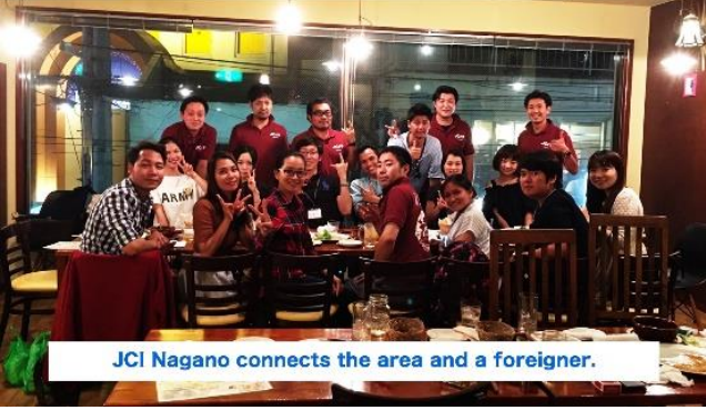
JCI Nagano connects the area and a foreigner.