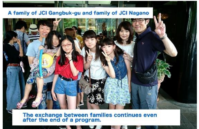
The exchange between families continues even after the end of a program.