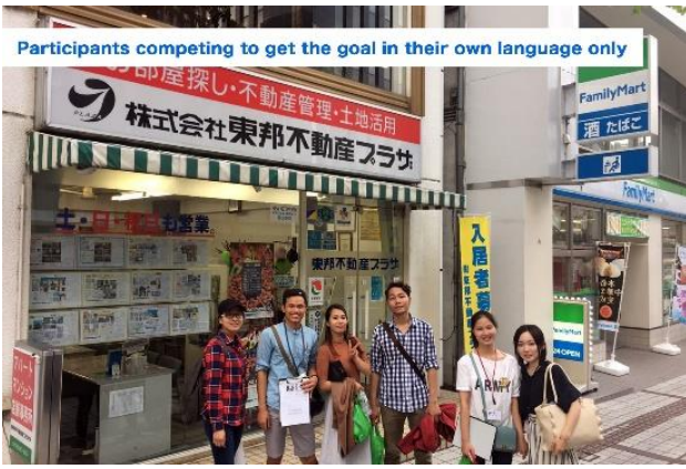
Participants competing to get the goal in their own language only