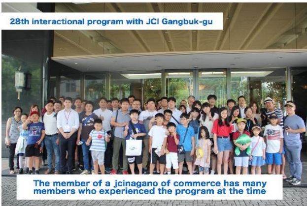
The member of a jcinagano of commerce has many members who experienced the program at the time