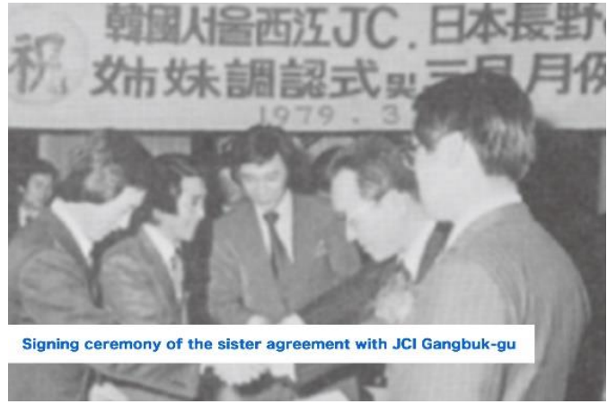
Signing ceremony of the sister agreement with JCI Gangbuk-gu

「メンバーへの影響と JCI ビジョンへの貢献」項目に添付する画像を下部に貼付してください