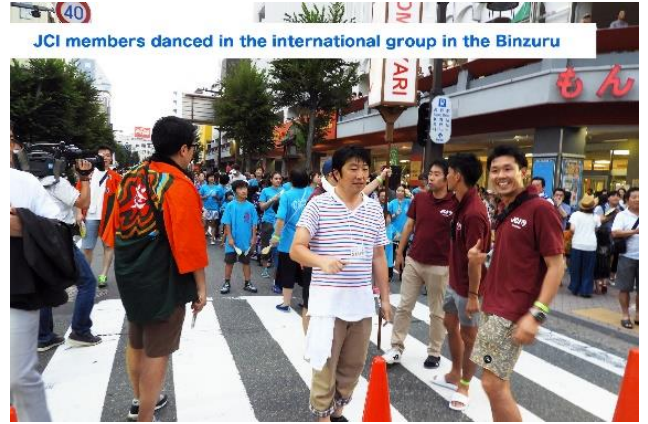
JCI members danced in the international group in the Binzuru