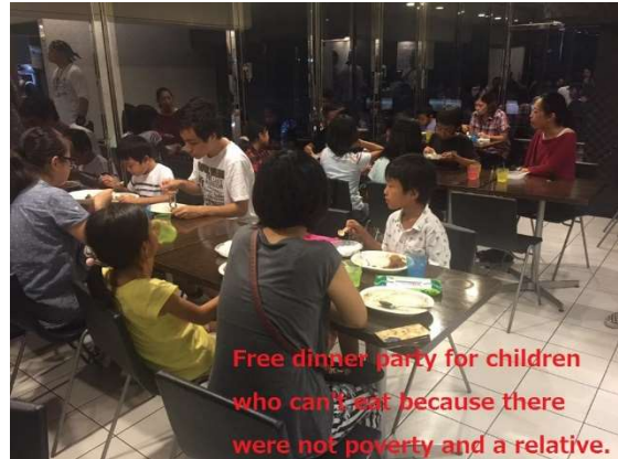
Free dinner party for children who can't eat because there were not poverty and a relative.