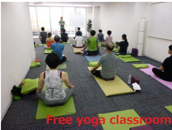
Free yoga classroom