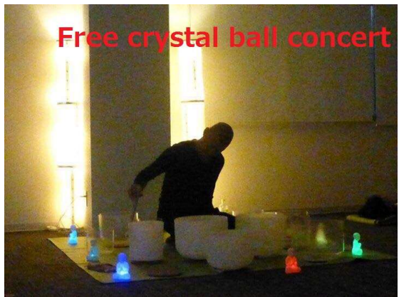
Free crystal ball concert