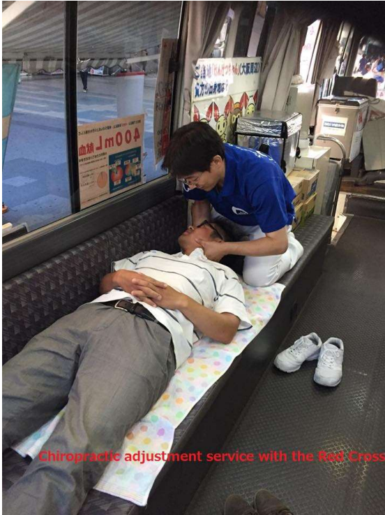
Chiropractic adjustment service with the Red Cross