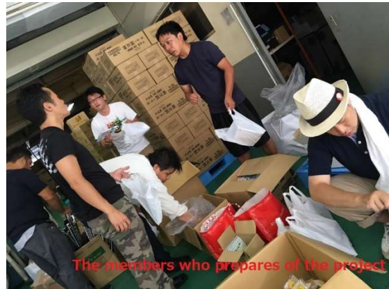
The members who prepares of the project