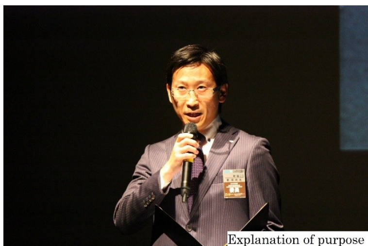
Explanation of purpose