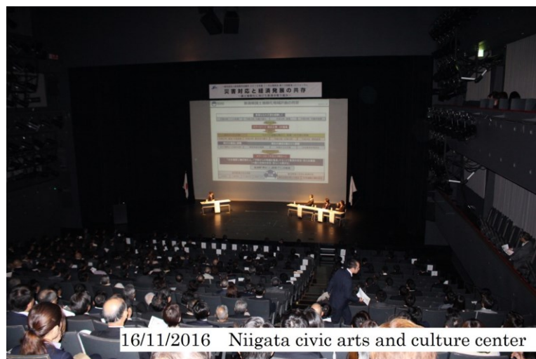
16/11/2016 Niigata civic arts and culture center