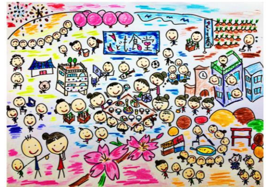
Children's Cafeteria, providing a place for all children in need, are sustainably operated through support of Kita Ward