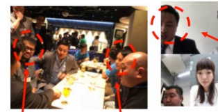
JCI Manila 2018 President JCI Victoria 2018 International Affairs Director JCI Ulaanbaatar 2018 President

Part 2: Panel discussion Preliminary survey and interview of LOMs from other countries (Meeting at ASPAC and through video conference)