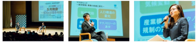
Part 1: Keynote presentation