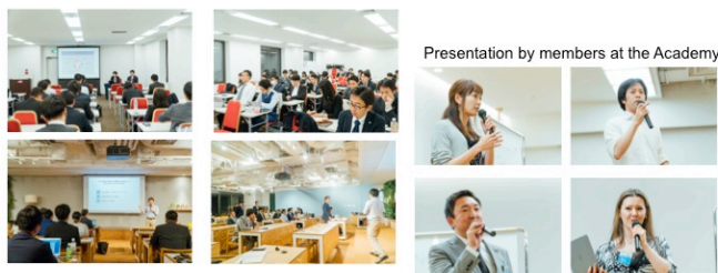
Presentation by members at the Academy