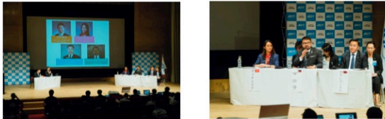
Part 2: Panel discussion

In advance, member LOMs of APICC were interviews about their activities. The 3 LOMs were invited as the most active in SDGs.