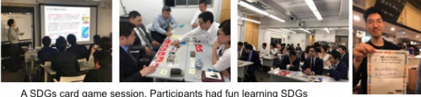
A SDGs card game session. Participants had fun learning SDGs

Even though managements is willing to incorporate SDGs into business, questionnaires have shown that low awareness on SDGs amongst employees is posing a challenge. We have organized "SDGs card game" sessions with outside participants, proving it to be an effective method to raise awareness among the public.