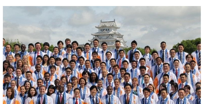
Together with many of the JCI Academy delegates. They learned much through the JCI Academy, before returning to their respective hometowns.