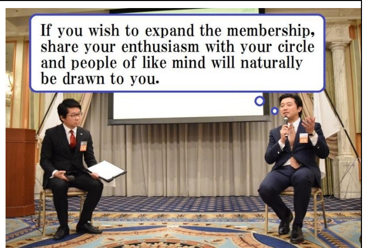
「プロジェクトの影響」項目に添付する画像を下部に貼付してください