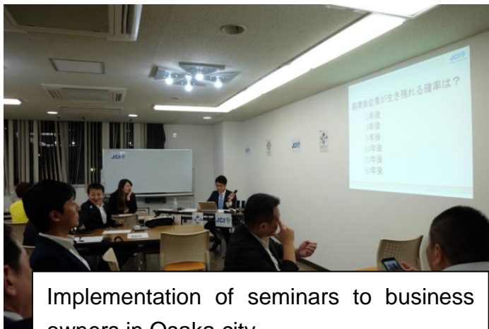
Implementation of seminars to business owners in Osaka city