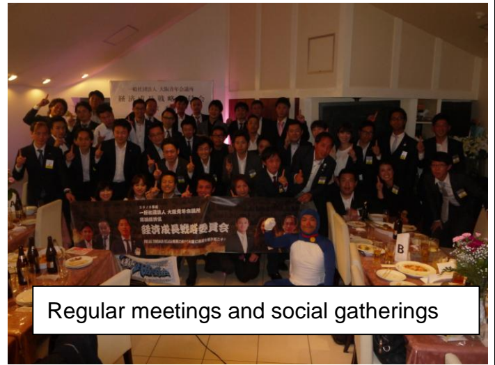
Regular meetings and social gatherings

62% of those who are interested in sustainable development management