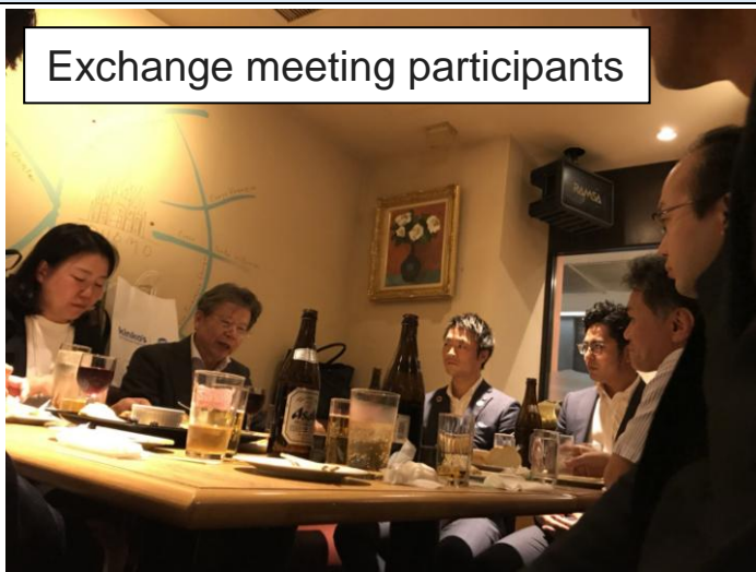
Exchange meeting participants