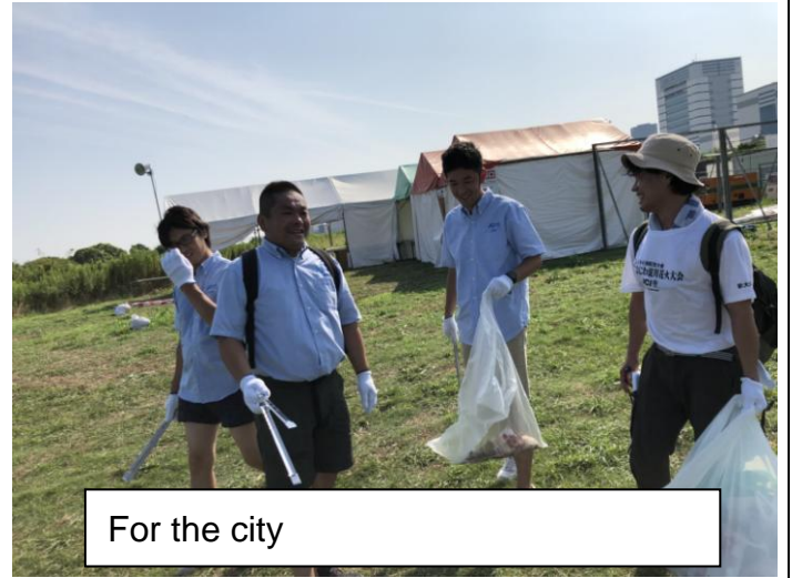
For the city