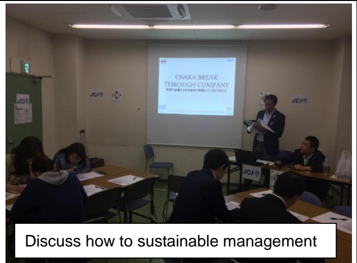
Discuss how to sustainable management