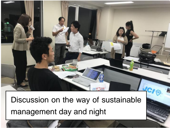
Discussion on the way of sustainable management day and night