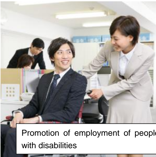
Promotion of employment of people with disabilities