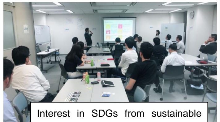
Interest in SDGs from sustainable development possible management