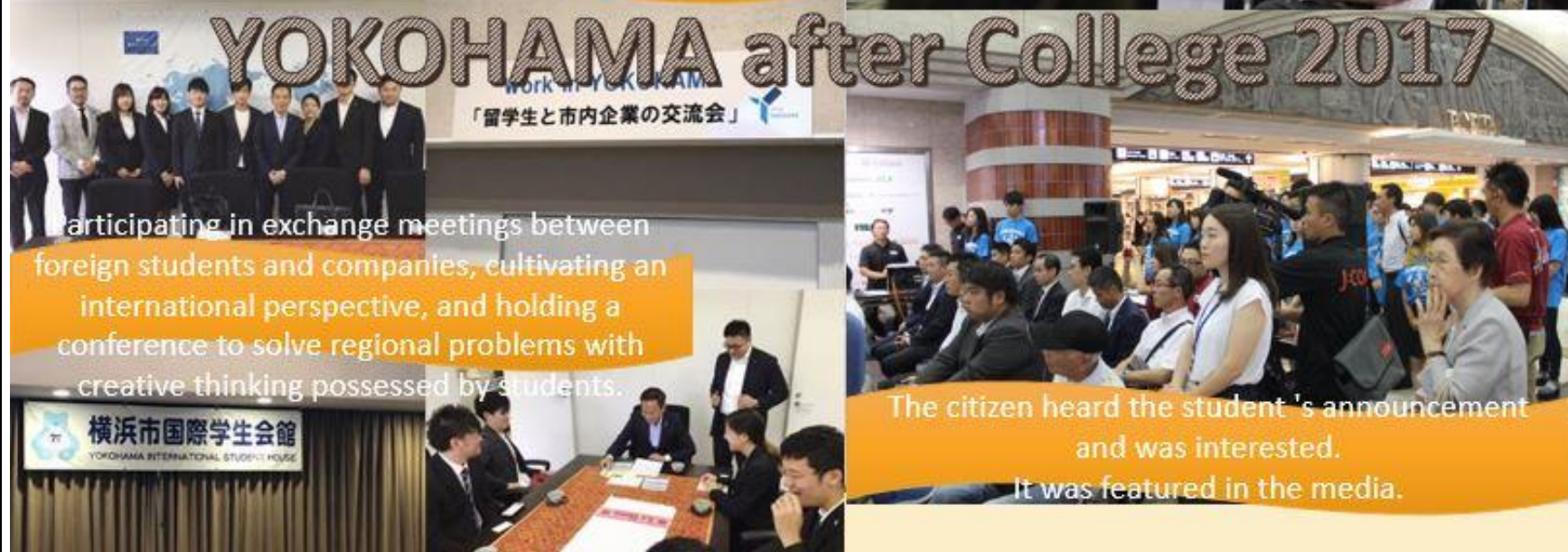
Participating in exchange meetings between foreign students and companies, cultivating an international perspective, and holding a conference to solve regional problems with creative thinking possessed by students.