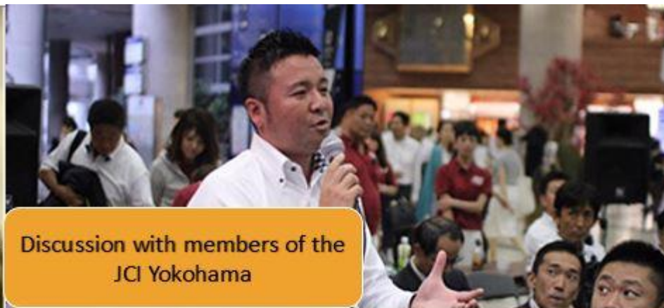
Discussion with members of the JCI Yokohama