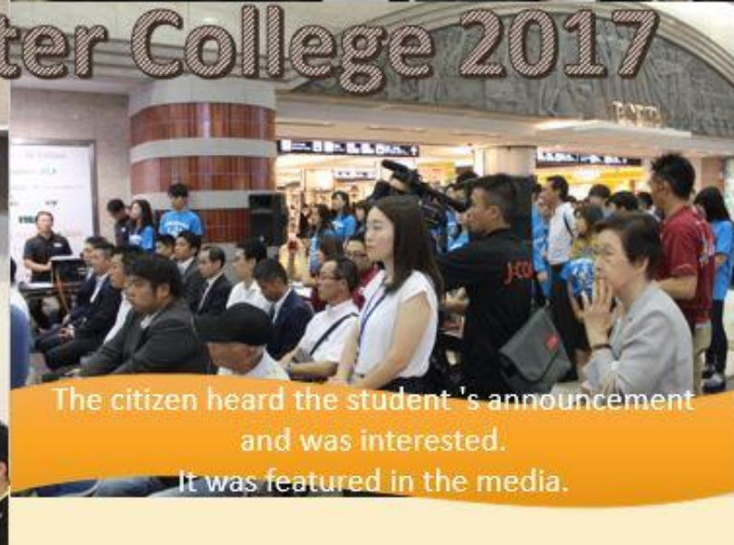
The citizen heard the student's announcement and was interested. It was featured in the media.