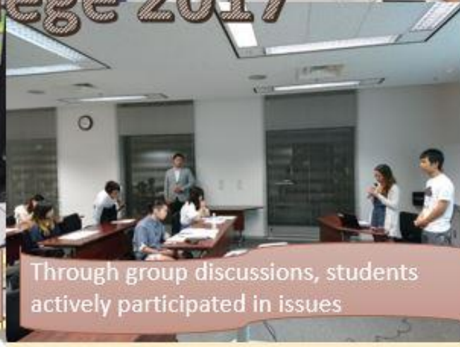
Through group discussions, students actively participated in issues