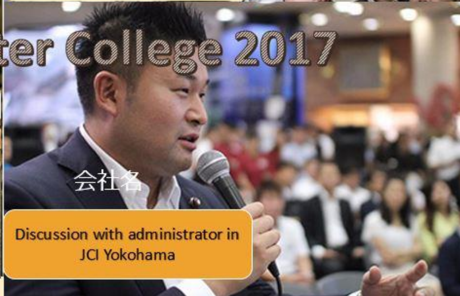
Discussion with administrator in JCI Yokohama