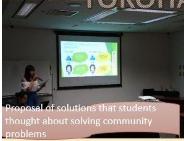
Proposal of solutions that students thought about solving community problems