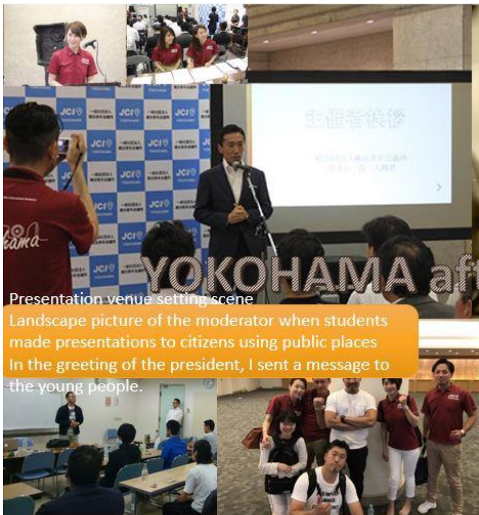
Presentation venue setting scene