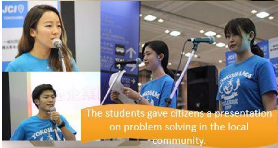
The students gave citizens a presentation on problem solving in the local community.