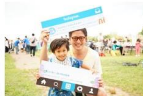
Sapporo citizen and instant gram