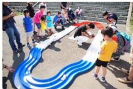
The Sapporo citizen who enjoys it in the playground equipment of the riverside