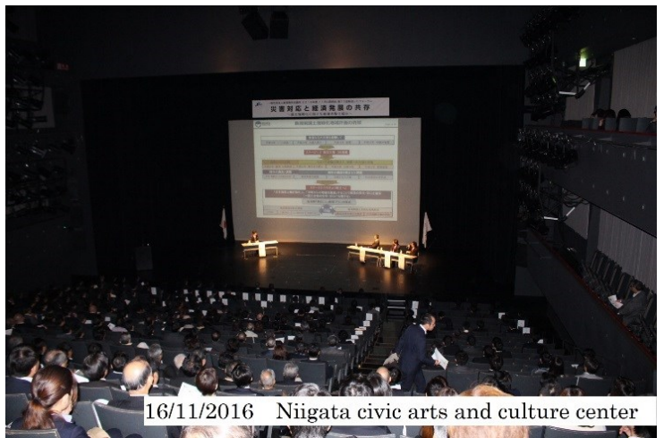
16/11/2016 Niigata civic arts and culture center