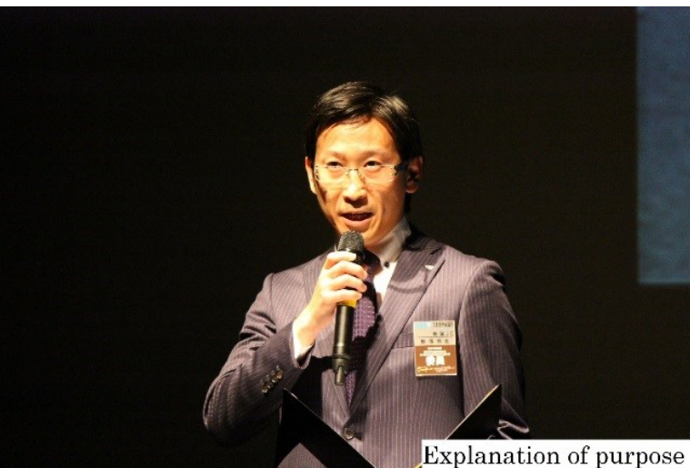
Explanation of purpose