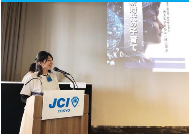
Serve as MC for JCI Event