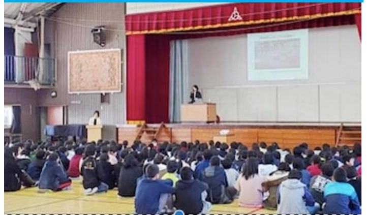
Media Literacy Lecture at Elementary School