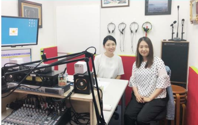
Radio Recording at TOKYO Local Station