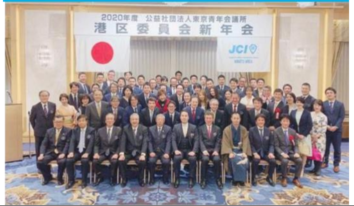
JCI MINATO City 2020 New Year's Party