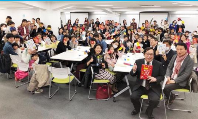
MATH Literacy Event I hosted for Parents and Children