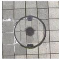
従来のマンホール