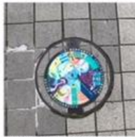
子供の絵が下水のイメージを向上させた