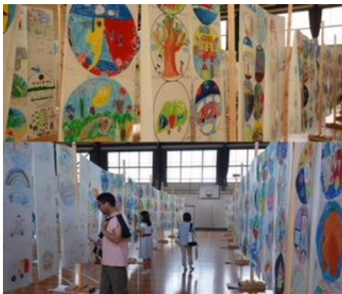
2000人の小学生が未来の豊田市をイメージし参加したコンテストは行政、教育関係者から強く意識された。