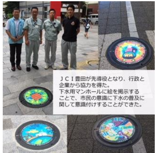
J C I 豊田が先導役となり、行政と企業から協力を得た。下水用マンホールに絵を掲示することで、市民の意識に下水の普及に関して意識付けすることができた。