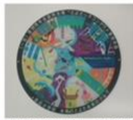
入賞者の絵をプレートに印刷