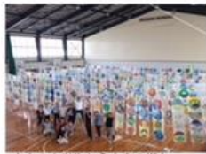
市内の小学生から未来の街をテーマに絵を募集した