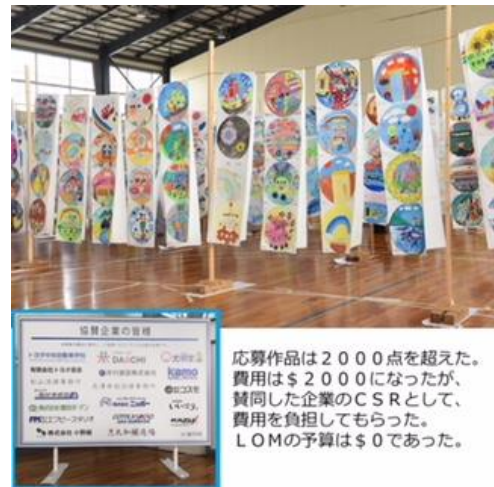
応募作品は2000点を超えた。費用は$2000になったが、賛同した企業のCSRとして、費用を負担してもらった。LOMの予算は$0であった。