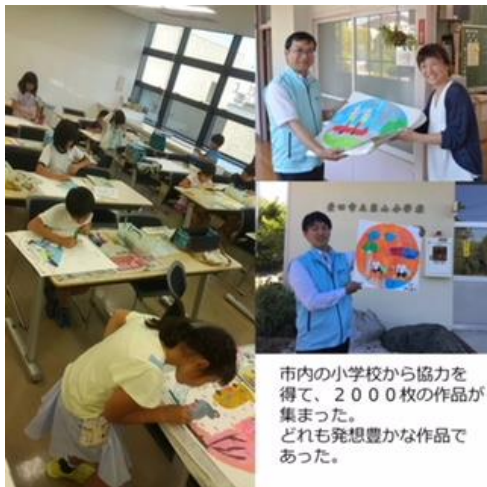
市内の小学校から協力を得て、2000枚の作品が集まった。どれも発想豊かな作品であった。