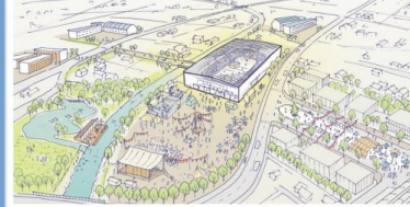
015 Hachinohe Multipurpose Arena Image Scheduled completion of spring in 2020