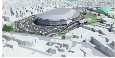
013 Hachinohe Skating Arena image Scheduled to be completed in June 2019