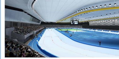
014 Hachinohe Skating Arena image Scheduled to be completed in June 2019